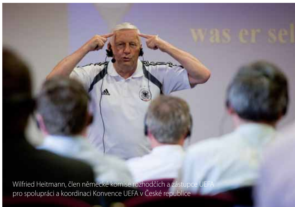
Wilfried Heitmann, člen německé komise rozhodčích a zástupce UEFA pro spolupráci a koordinaci Konvence UEFA v České republice